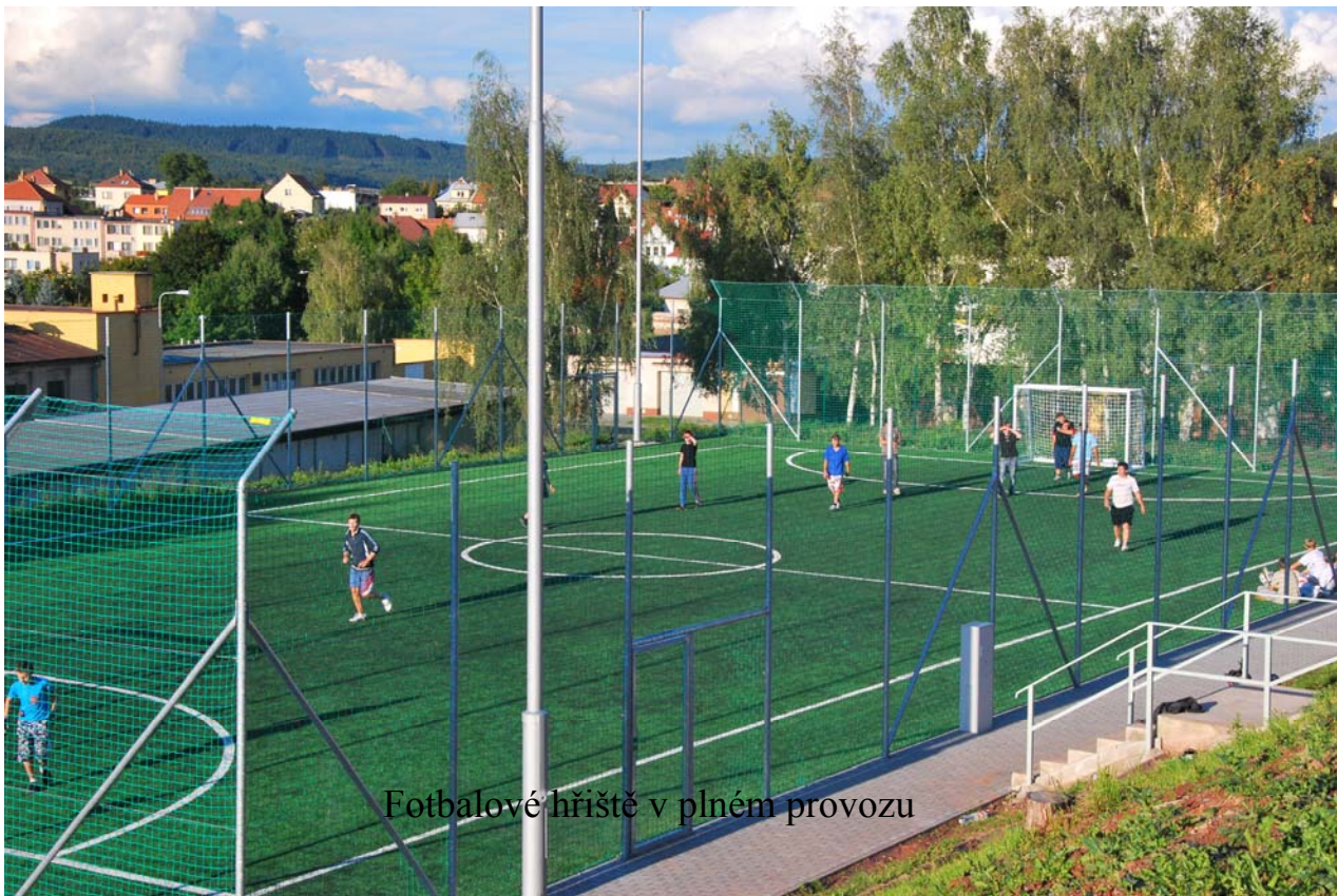
Fotbalové hřiště v plném provozu