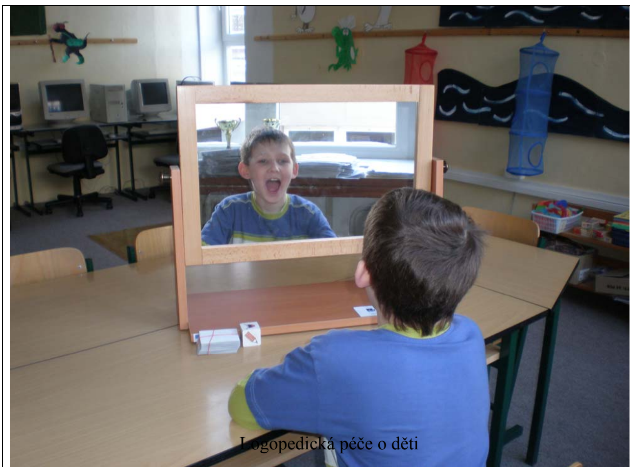
Logopedická péče o děti