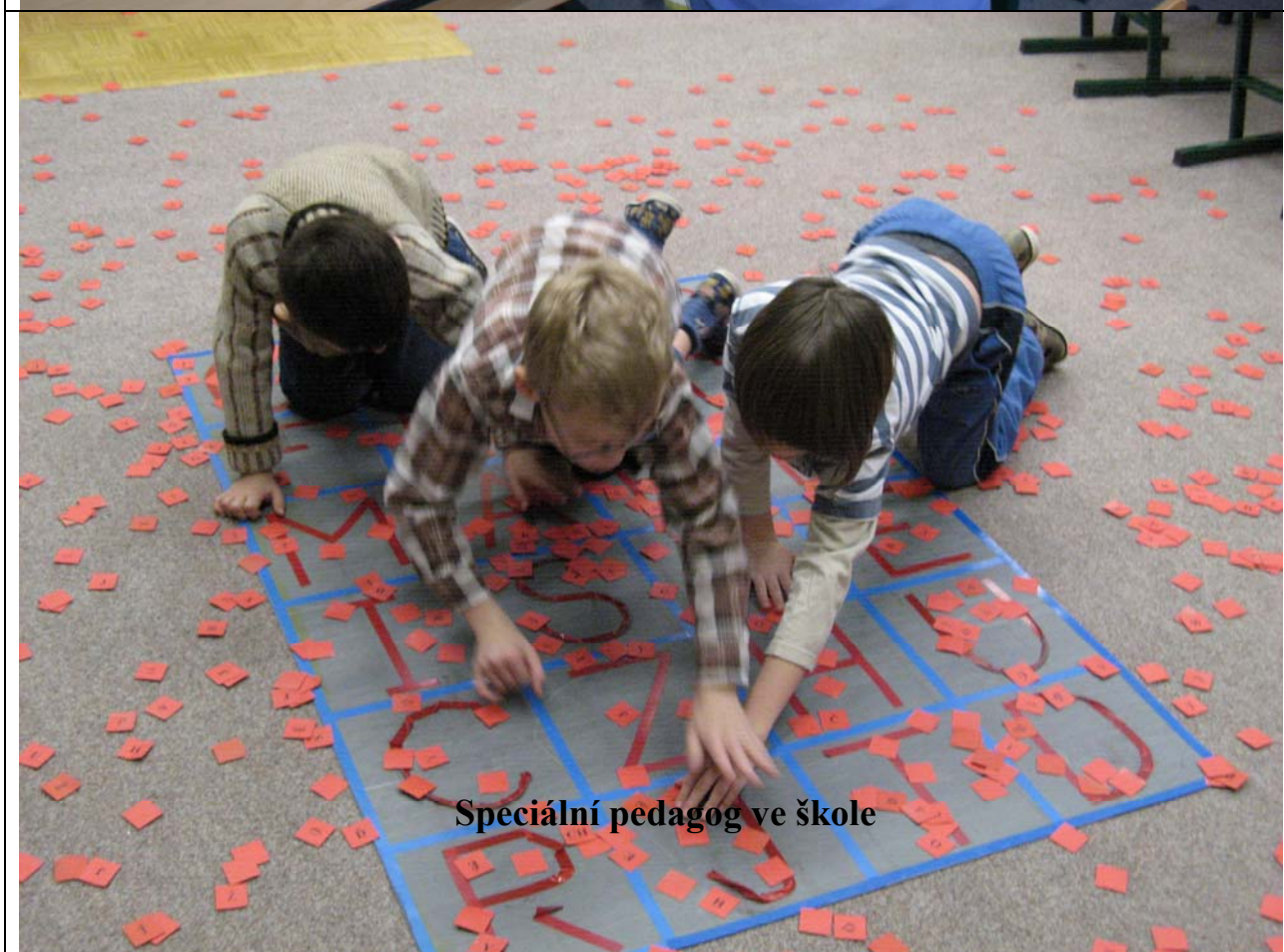
Speciální pedagog ve škole